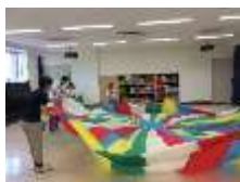
ミュージック・アート班

今年も新しい仲間が集まり、楽しい活動が始まりました。半日の活動が8回、終日の活動が2回、計10回の活動を予定しています。各班とも工夫を凝らし、ペアやグループでいろいろな活動に挑戦していきます。5月31日から縦割り給食も始まりました。