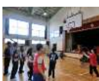
スポーツ・ゲーム班