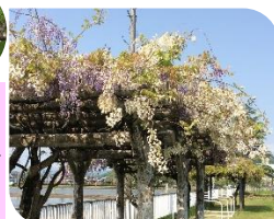
グラウンドの藤棚

学校の敷地内、花壇やグラウンド、中庭では、いろいろな花が満開の時期を迎えています。ピンクの芝桜、白・紫・ピンクの藤、白・赤・ピンクのつつじ、白いブルーベリーなど、朝露をうけてキラキラと光っています🌸🌸🌸 中学部のみなさん、花壇の整備をありがとう!