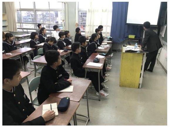
税金から学ぶ社会とは