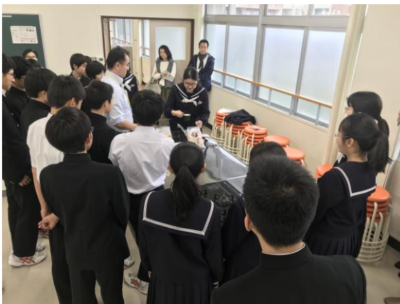
福井の新たなお米「いちほまれ」のブランド化について