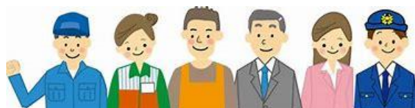
夢をかなえる生き方