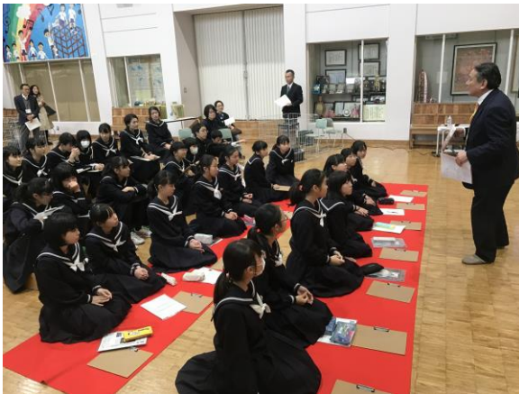
これからの美術館の楽しみ方