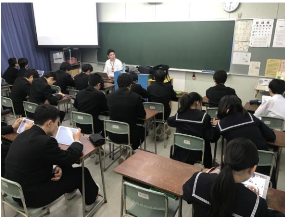
田舎から大海原への、挫折に満ちた航海