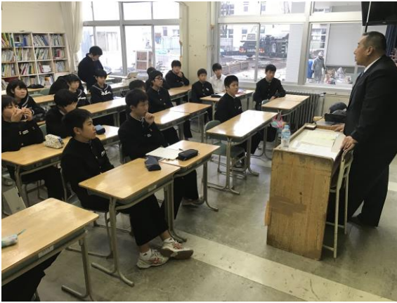
野球を通じて人間形成・育成について