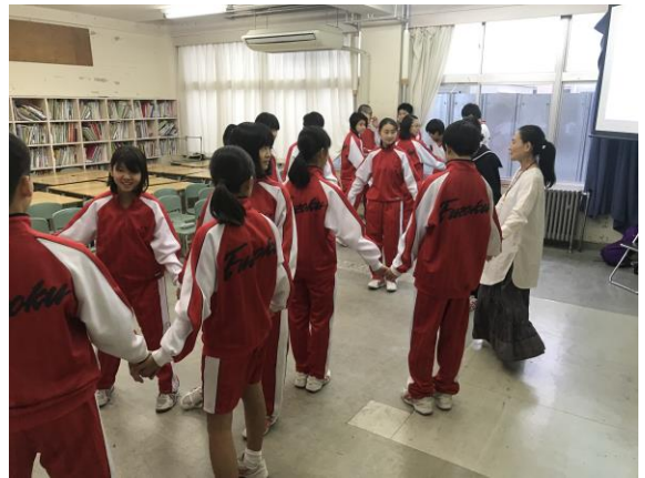
ヨガを体験してみよう