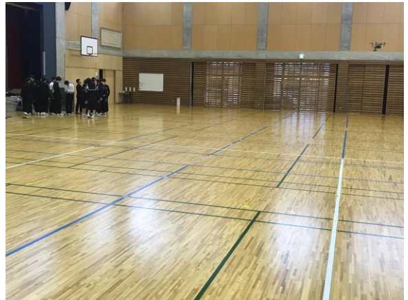
自然災害からの防災と最新ドローン技術