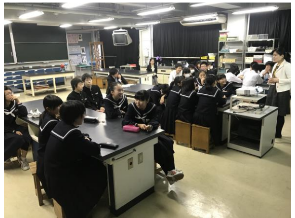
挑戦はいくつからでもできる！