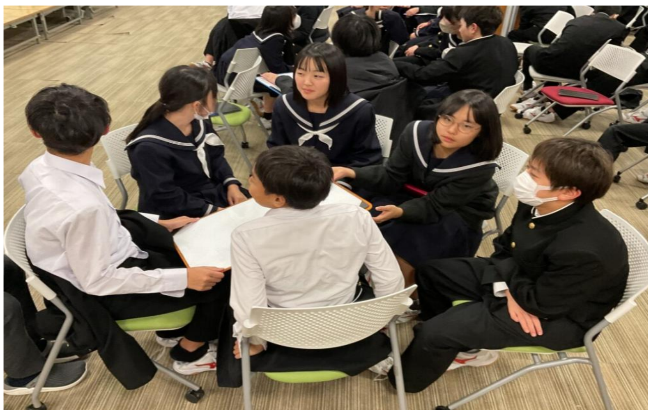
(グループで話し合っている様子)