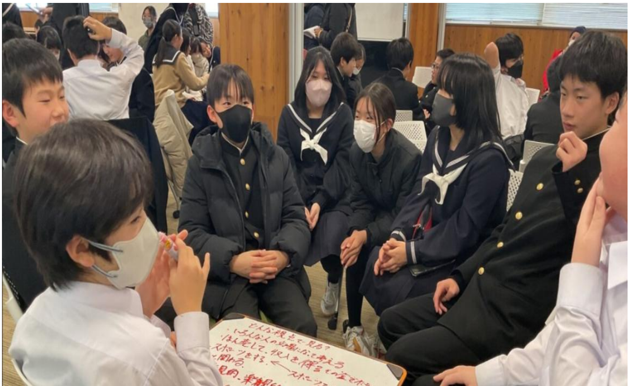
(グループで話し合っている様子)