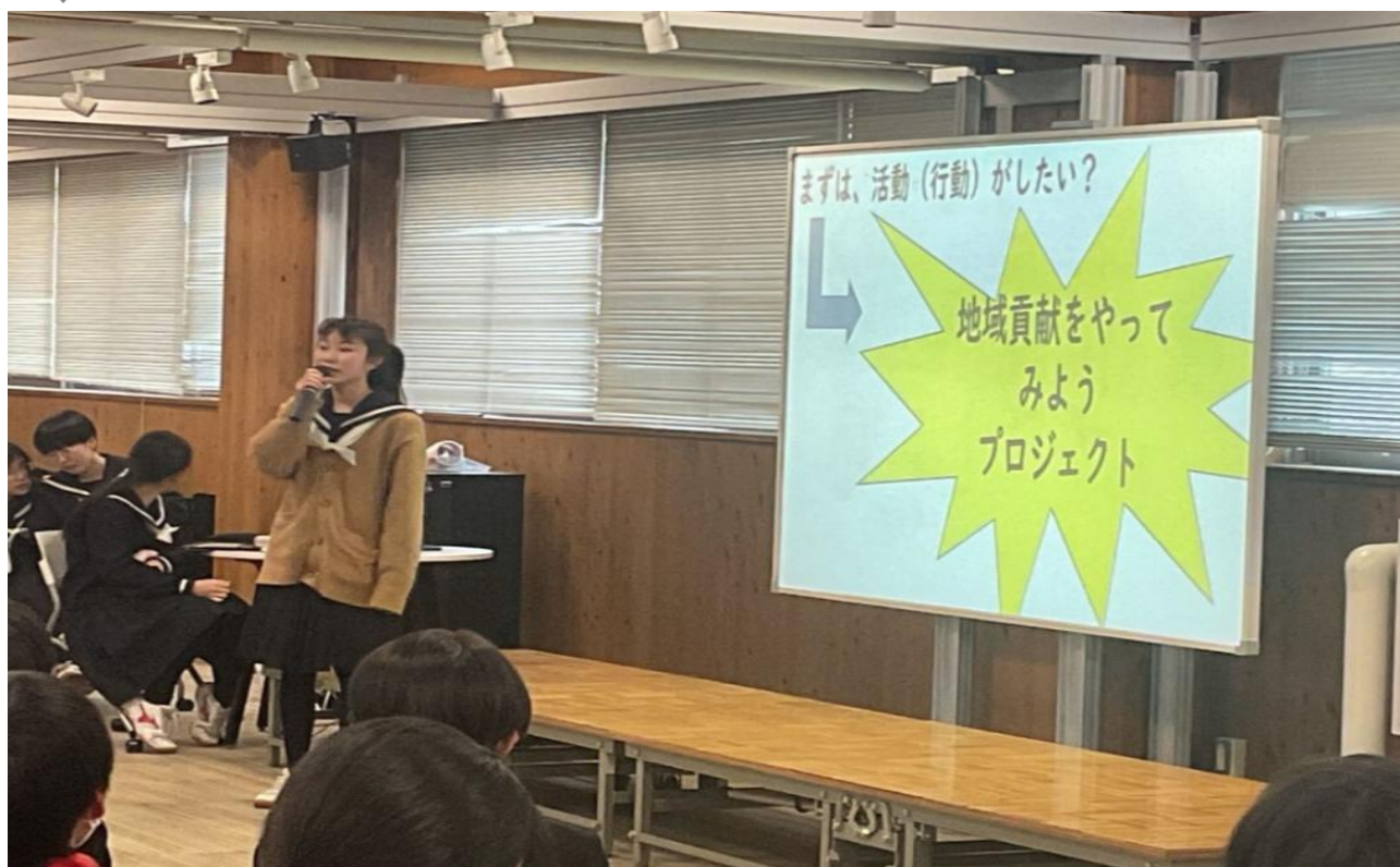
(実行委員長からの話)